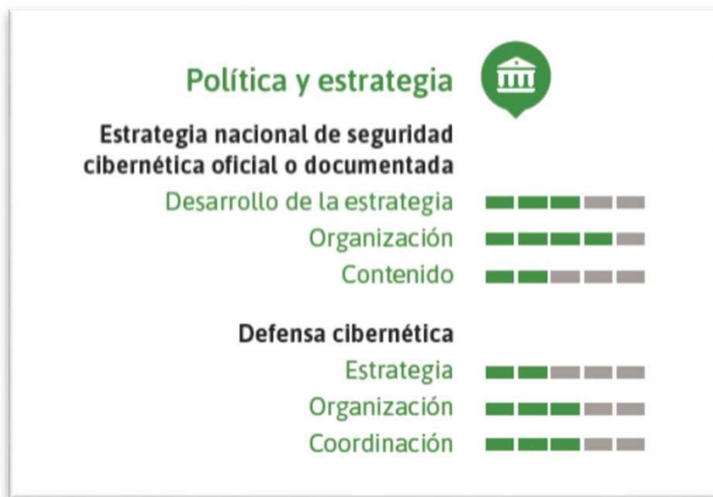
Figura 3. Valoración para Uruguay de Indicadores correspondientes al Área Política y Estrategia. Ciberseguridad ¿Estamos preparados en América Latina y el Caribe? 26

Cada uno de los indicadores, fue evaluado individualmente para todos los países de América Latina y el Caribe, estableciéndose cinco niveles de madurez. Los mismos se definieron como: Inicial, Formativo, Establecido, Estratégico y Dinámico, correspondiendo a cada uno un valor de uno a cinco respectivamente. Como es posible observar en la Figura 3, el país recibe en cuatro de los seis indicadores del área de política y estrategia una evaluación de estado Establecido o Estratégico, siendo los dos indicadores restantes evaluados como en estado Formativo.